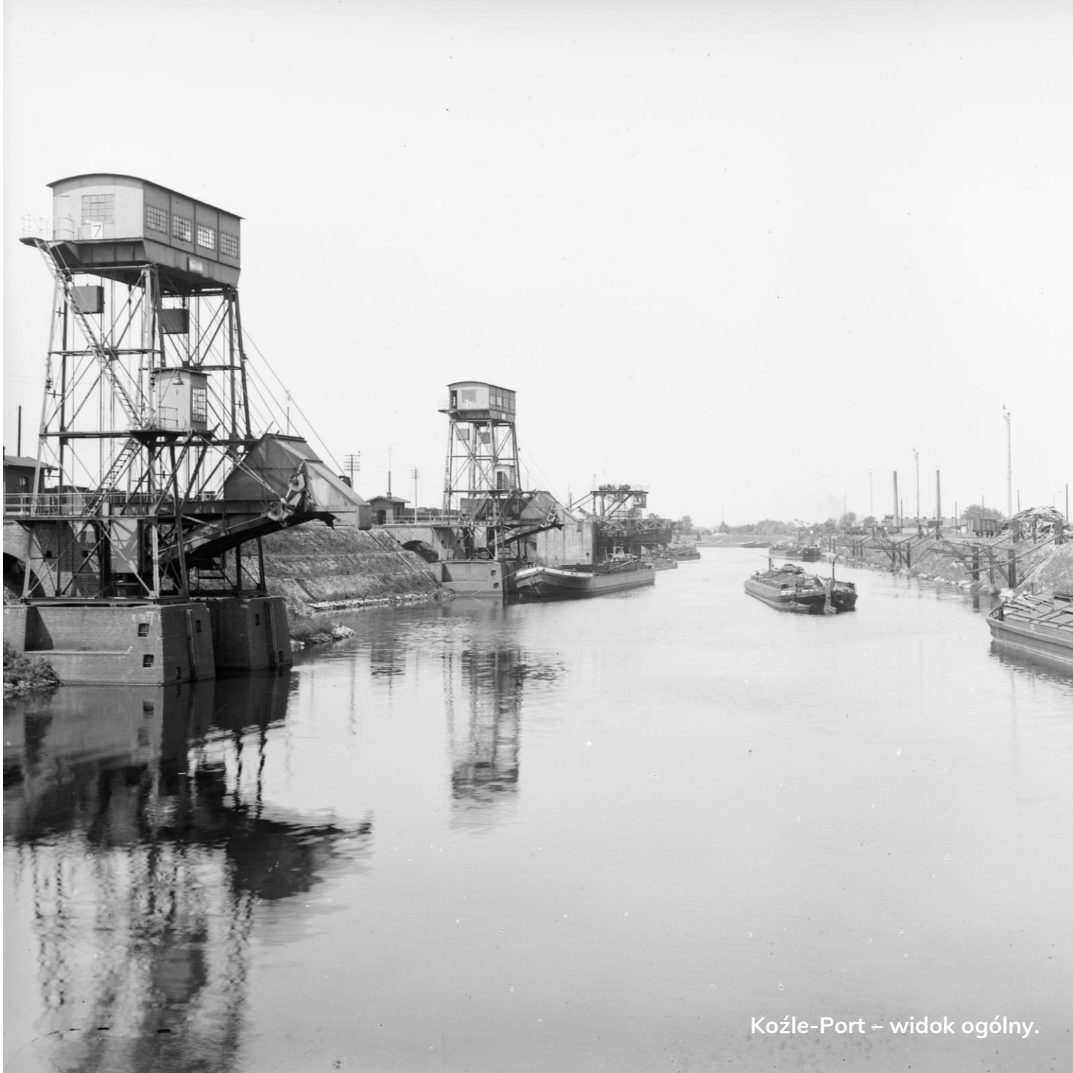
Koźle-Port – widok ogólny.