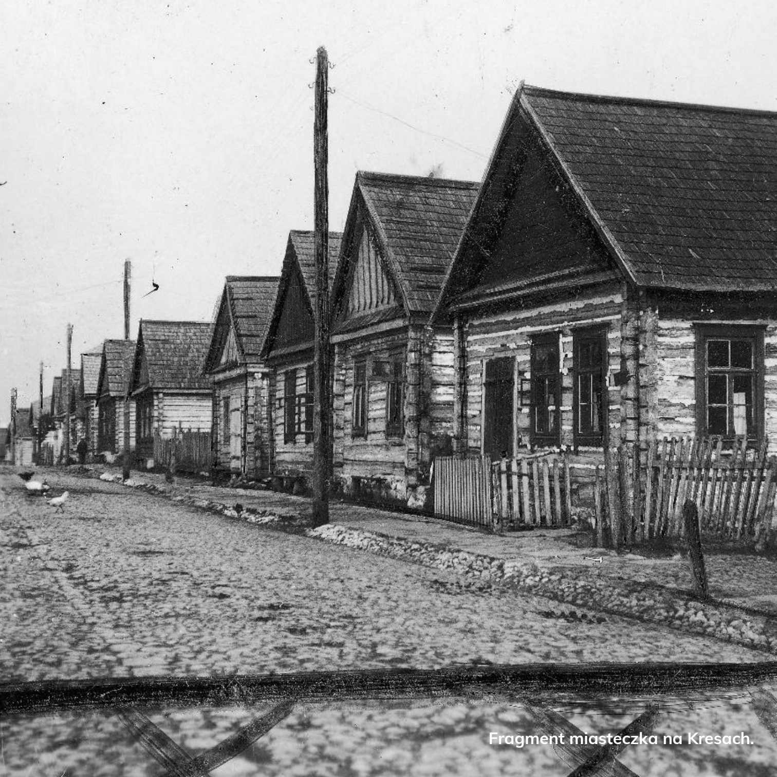
Fragment miasteczka na Kresach.