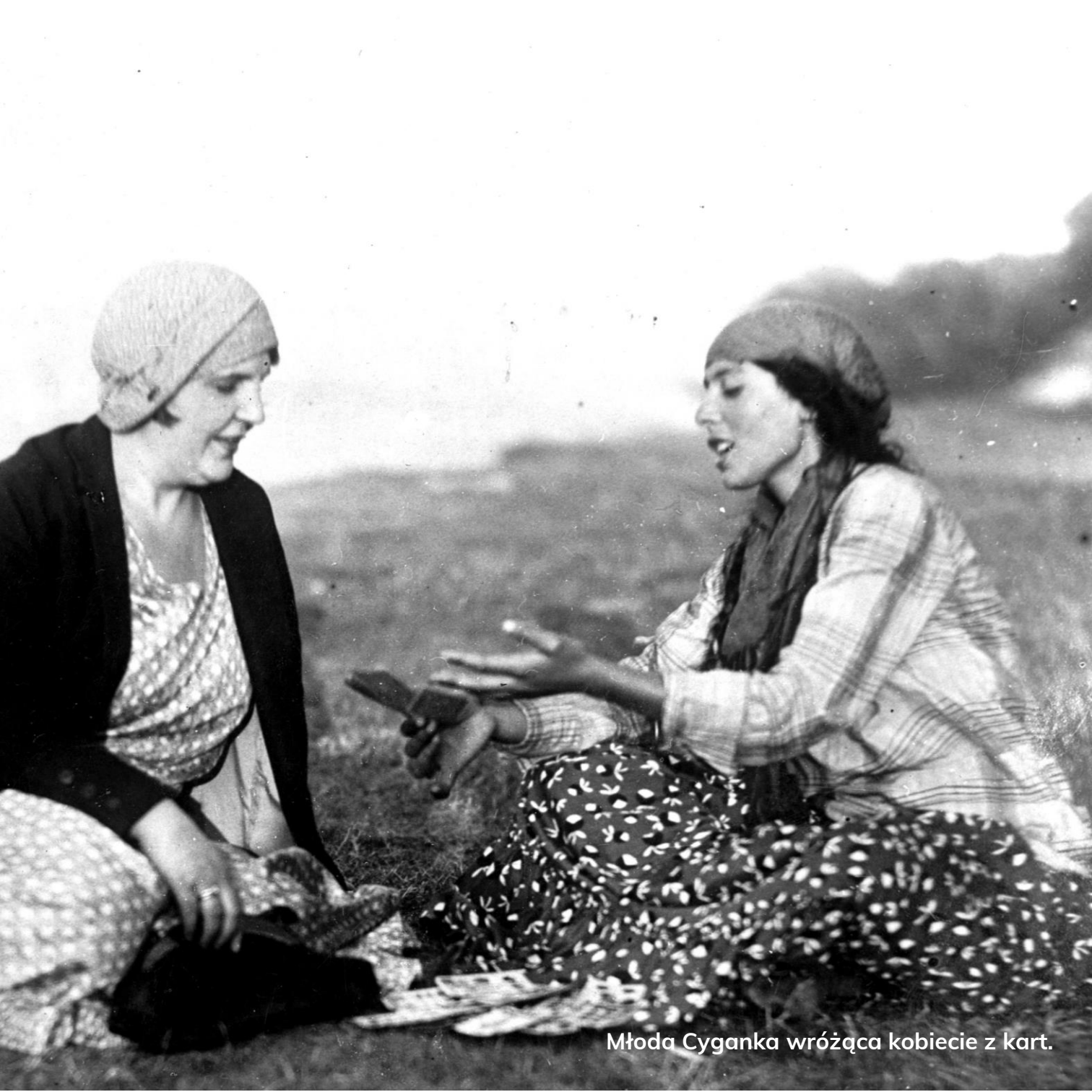
Młoda Cyganka wróżąca kobiecie z kart.