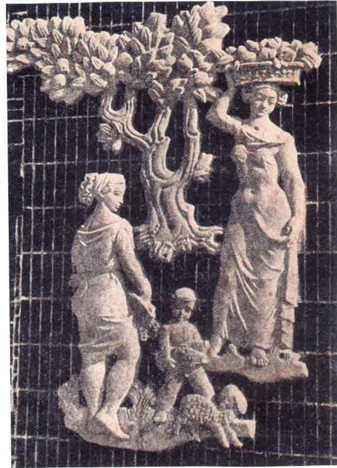
pierwotny wygląd płaskorzeźby Plon z okładki Architektury 1948 nr 4